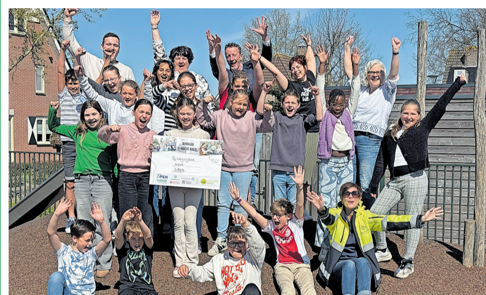
Winnaar 2025 Hoogblokland

De school met de meeste punten wint een schoolreisje naar het Nemo Science Museum in Amsterdam! Dus steun de leerlingen in uw omgeving en werk mee aan een afvalvrije regio! Meer info op: waardlanden.nl/ewasterace .