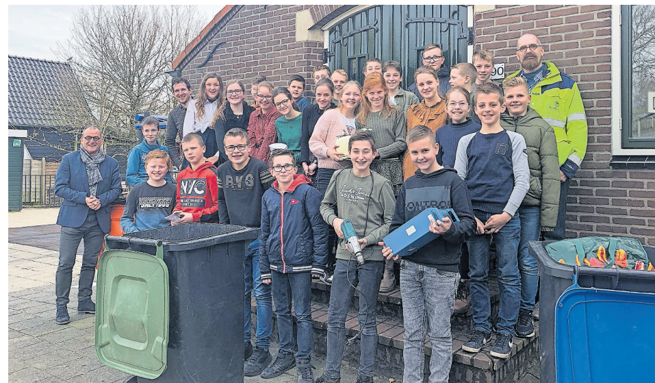
Foto: Wethouder Johan Quik gaf vorige week het startsein op de basisschool in Streefkerk

Als u uw klein elektronisch afval apart inlevert, zorgt u ervoor dat schadelijke stoffen niet in het milieu terecht komen en zijn er minder nieuwe grondstoffen nodig. De E-waste Race maakt het u gemakkelijk doordat leerlingen het afval bij u thuis komen ophalen. De kinderen krijgen punten voor het ingezamelde E-waste. De school met de meeste punten wint een geheel verzorgd schoolreisje!