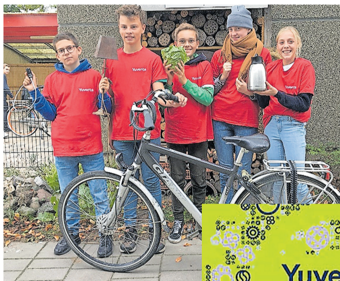
Foto: Leerlingen van de werkgroep Eco-schools

Kijk voor meer info op de website www.duurzaammolenlanden.nl . Heeft u ook een tip en/of wilt u meedoen? Stuur dan een mail naar info@duurzaammolenlanden.nl .