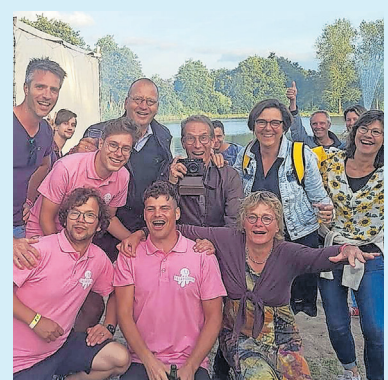
Bekende gezichten op Blauwalg Festival (Goudriaan)