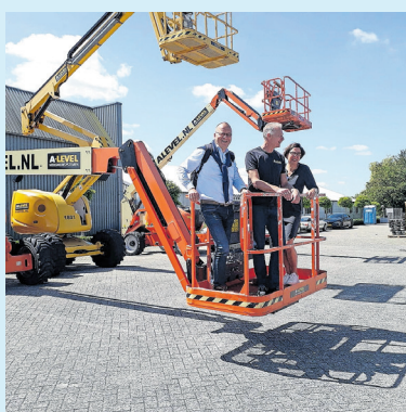
Molenlanden van boven gezien bij A-Level (Molenaarsgraaf)