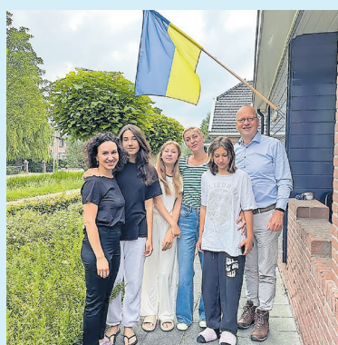
Ontmoeting met Oekraïners in de Arend (Ottoland)