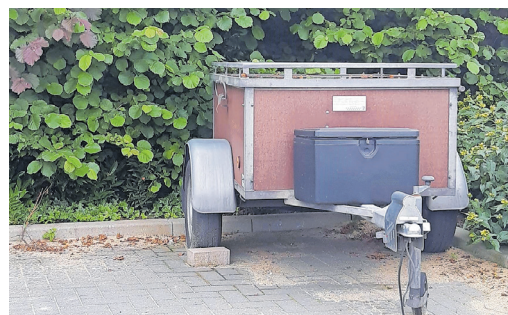
Parkeerplaats Klipperstraat Nieuw-Lekkerland

Voor vragen of meer informatie kunt u contact opnemen met het cluster Veiligheid via telefoonnummer 088 7515000.