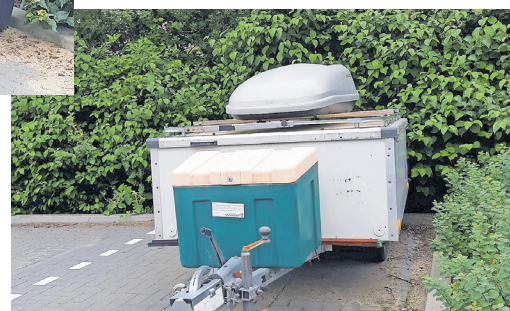
Parkeerplaats Klipperstraat Nieuw-Lekkerland