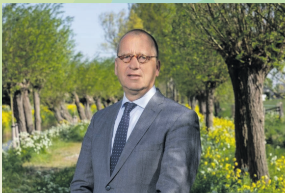
Theo Segers, burgemeester

Vanwege het Covid-19 virus blijven ook veel mensen thuis of is de vakantie anders dan vooraf was bedacht. Er zijn ook mensen die helemaal niet weg kunnen. Daarom vraag ik u om goed om u heen te kijken, in de omgeving waar u woont. Sommige mensen vinden vakantie namelijk de meest vervelende tijd van het jaar. Maak eens een praatje, ga eens langs. Nu is er tijd voor en u bezorgt de ander een mooi moment. Een goede vakantietijd toegewenst!